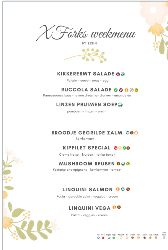
Menu week 10